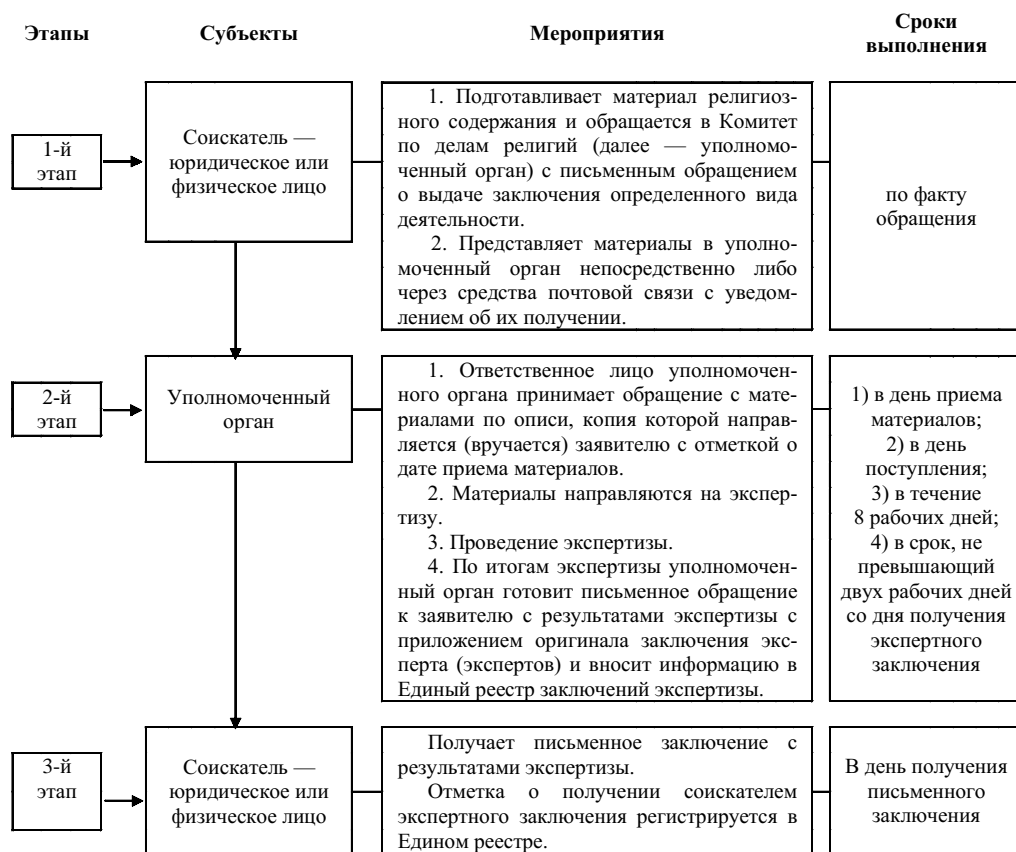
СХЕМА проведения государственной религиоведческой экспертизы материалов религиозного содержания