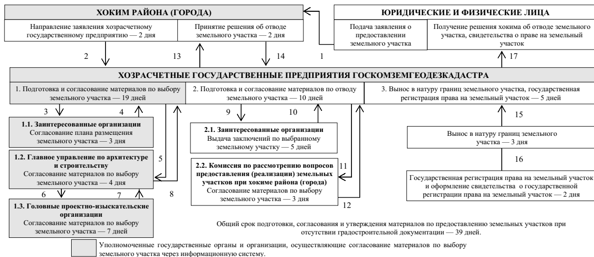
СХЕМА согласования материалов выбора земельного участка с уполномоченными организациями с применением информационной системы при предоставлении земельного участка вне населенных пунктов (при отсутствии градостроительной документации*)

* При наличии градостроительной документации (генеральный план населенного пункта, проект архитектурно-планировочной организации территории схода граждан кишлаков (аулов), проект детальной планировки рассматриваемой территории) материалы выбора земельного участка согласованию с главными управлениями по архитектуре и строительству областей и головными проектно-изыскательскими организациями не подлежат.