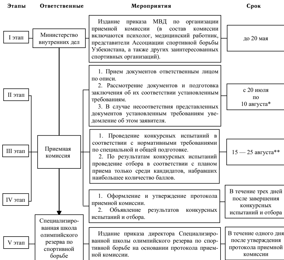
СХЕМА приема учащихся в Специализированную школу олимпийского резерва по спортивной борьбе