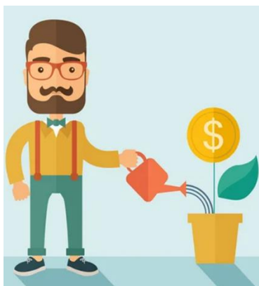
Инвестиция фаолиятининг иштирокчиси