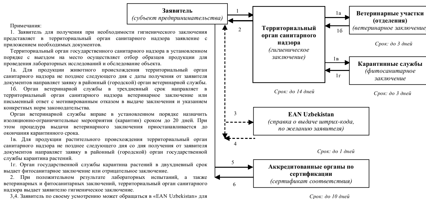
Схема прохождения процедур по сертификации продукции