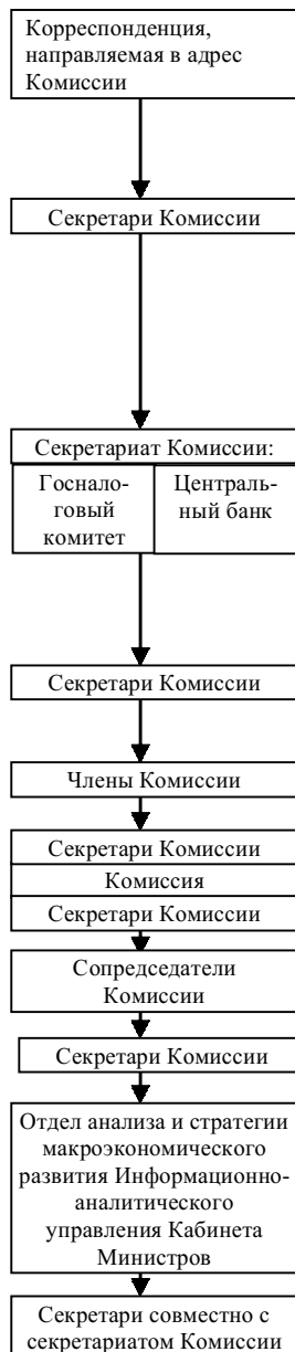
Схема организации деятельности Республиканской комиссии по сокращению просроченной дебиторской и кредиторской задолженности и укреплению дисциплины платежей в бюджет

Корреспонденция, предназначенная для рассмотрения на Комиссии, направляется: по вопросам сокращения просроченной дебиторской и кредиторской задолженности — в Центральный банк Республики Узбекистан; по вопросам своевременности поступлений налогов и обязательных платежей в бюджет и представления отсрочки и (или) рассрочки по уплате задолженности по налогам и платежам в бюджет и государственные целевые фонды — в Государственный налоговый комитет Республики Узбекистан.