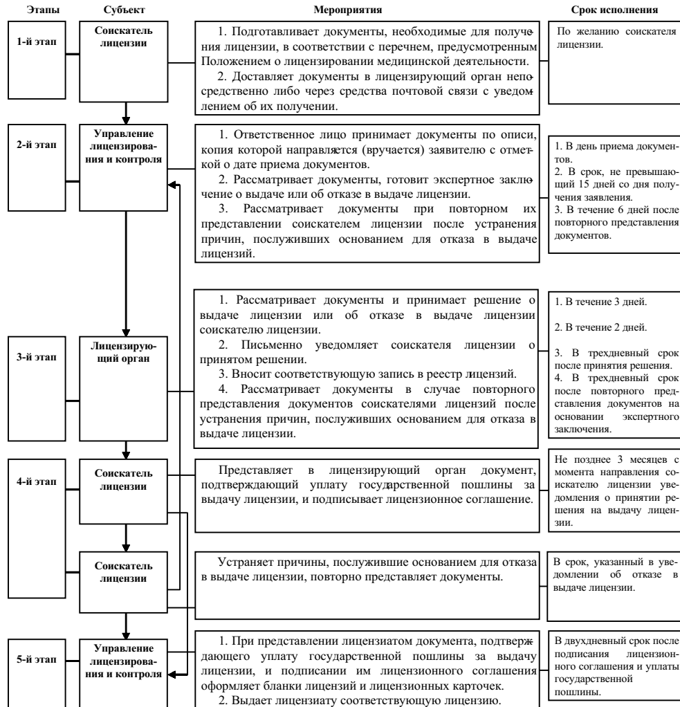
Схема лицензирования медицинской деятельности