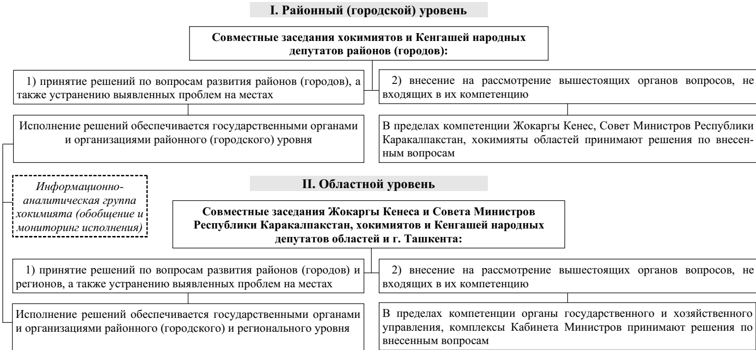
СХЕМА подведения итогов социально-экономического развития страны