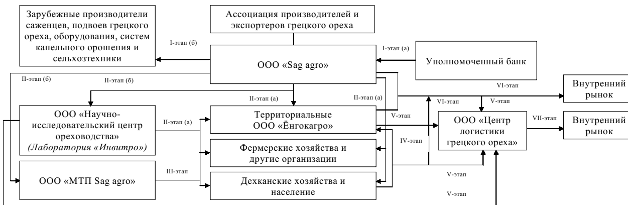
СХЕМА взаимодействия организаций, входящих в состав Ассоциации производителей и экспортеров грецкого ореха