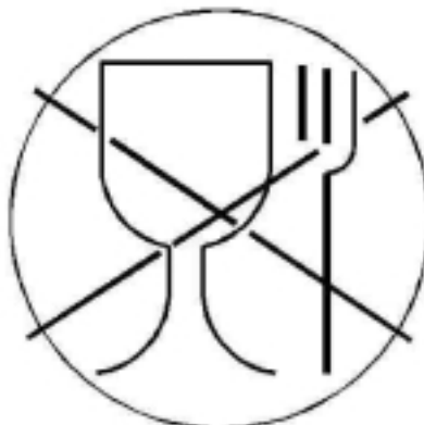
Рисунок 2 — для товаров бытовой химии