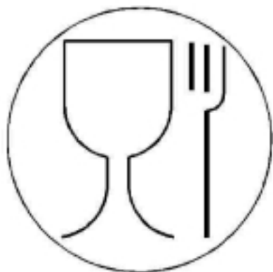
Рисунок 1 — для пищевой продукции